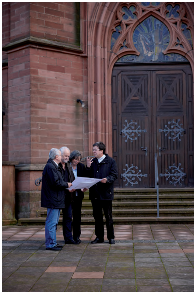
Der folgende Ablaufplan zeigt, wie eine Baumaßnahme in Ihrer Kirchengemeinde geplant werden könnte und wer Sie in Ihrem Bistum/in Ihrer Landeskirche berät.